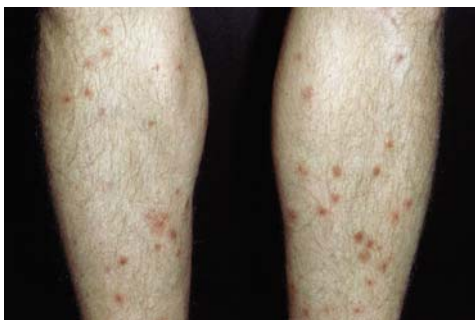
(© dr. Robert Konecny, Ufficio dell'ambiente di Vienna)