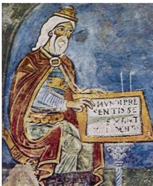
Ippocrate in un affresco del XIII sec. Anagni Cripta del Duomo

Se fossimo in grado di fornire a ciascuno la giusta dose di nutrimento ed esercizio fisico, né in eccesso né in difetto, avremmo trovato la strada per la Salute.